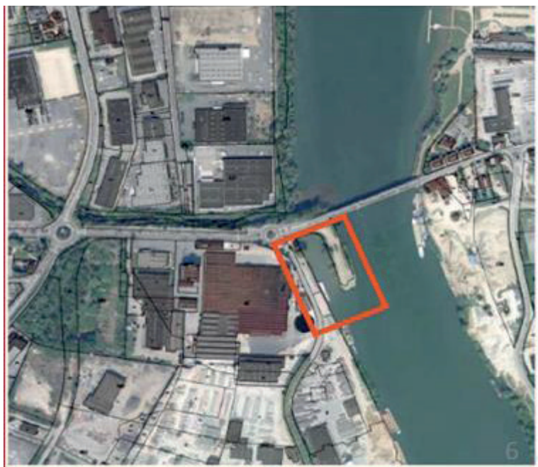
Darse d'hivernage, au sud du pont de Frans

Sur le plan quantitatif, le projet vise à permettre l'accueil de bateaux transportant chacun 160 passagers environ, et une trentaine de personnes pour l'équipage, soit 200 personnes maximum par bateau. La rénovation de la darsette donnera un caractère plus économique au lieu, en permettant l'entretien et la maintenance de gros bateaux.