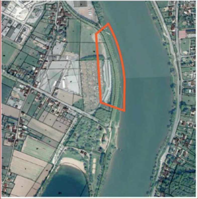
Appontement pour grands bateaux